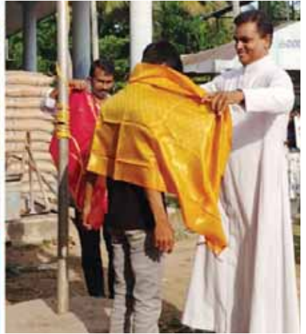
തൊഴിലാളികളുടെ മധ്യസ്ഥനായ യൗസേപ്പിതാവിന്റെ തിരുനാൾ ദിനവും ലോകതൊഴിലാളി ദിനവുമായ മേയ് 1 ന് അരയതുരുത്തി ഇടവക തൊഴിലാളികളെ ആദരിച്ചപ്പോൾ