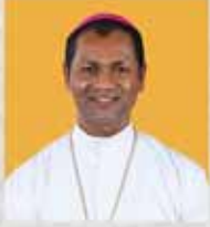
ST. PETER'S FORANE CHURCH

ഇടവക മദ്ധ്യസ്ഥനായ വിശുദ്ധ പത്രോസ് അപ്പസ്തോലന്റെ തിരുനാൾ മഹോത്സവം